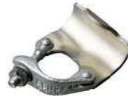
Putlog Coupler مربط كف