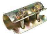
Sleeve Coupler مربط وطة