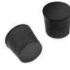
زطمة : Cap

stops the tube from moving and seals holes in formwork and moulds