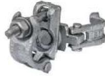
Swivel Coupler مربط متحرك