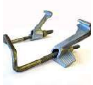
H20 Flange Clamp مربط خشب