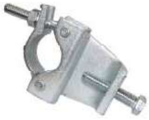
Girder Coupler مربط جسر