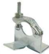
Board Retaining Clamp مربط خشب