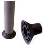
مواسير : Tube

يستخدم في الجدران والعمدان و الخرسانة مسبقة الصب Used in Walls, Columns and Precast Products