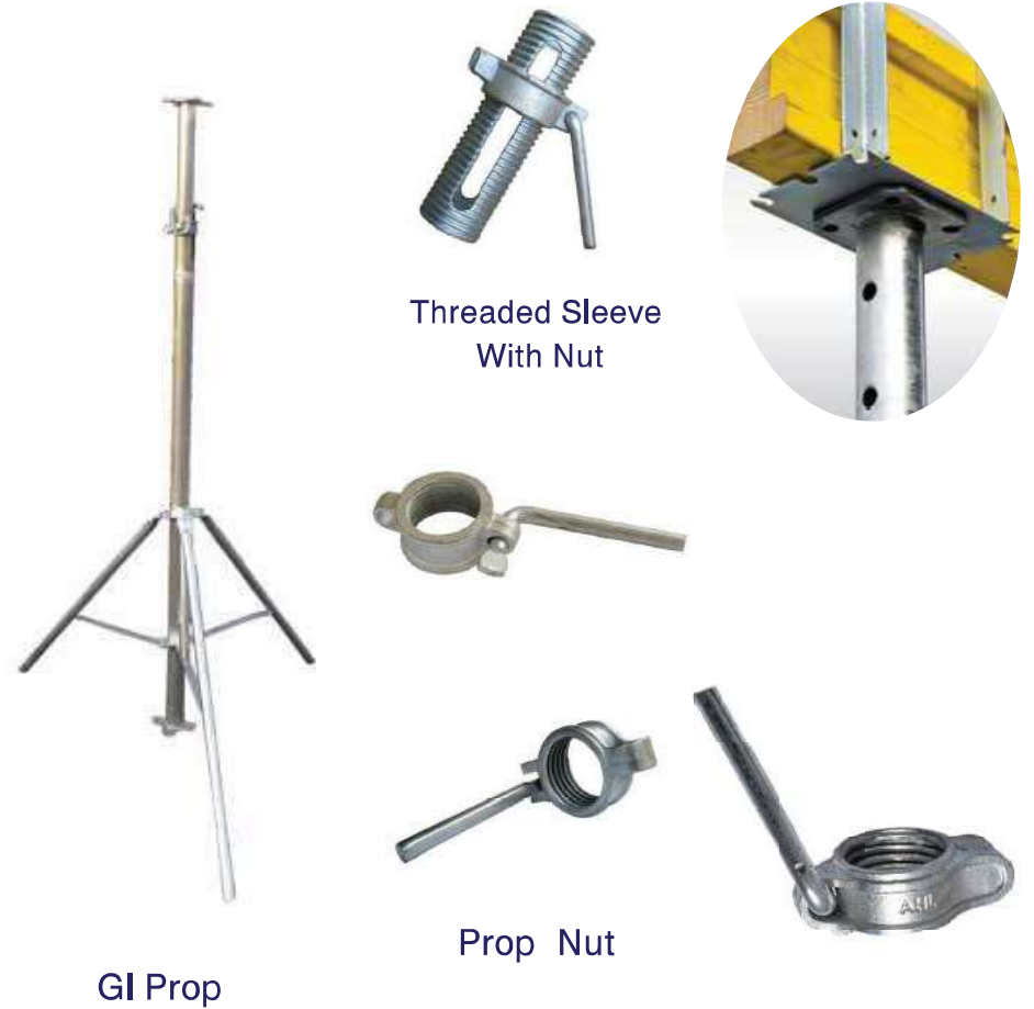
Threaded Sleeve With Nut