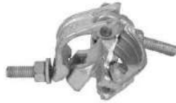
Double Coupler مربط ثابت